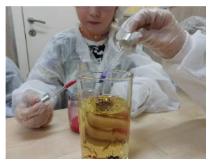
Разноцветный дождь в стакане