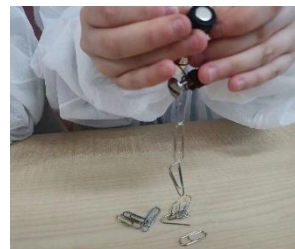
Преобразование электрического тока в магнитное поле