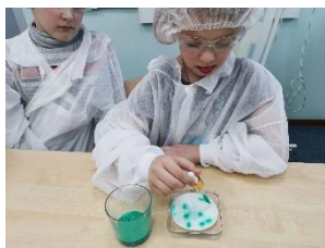
Что такое плесень и порча продуктов