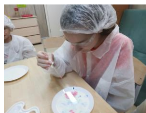
Рисование на молоке