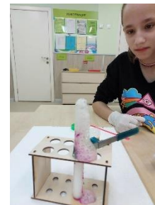
Взаимодействие кислот и щелочей

воспитанники приюта в возрасте от 7 до 12 лет